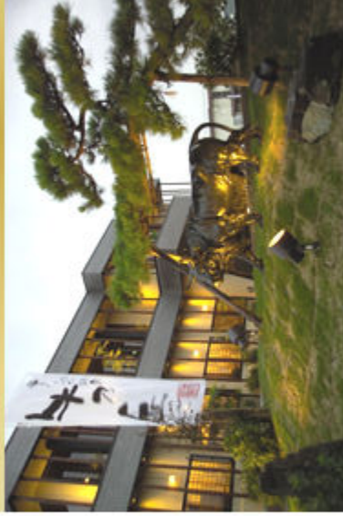
エントランスではプロソンスの神戸牛半がお迎えします