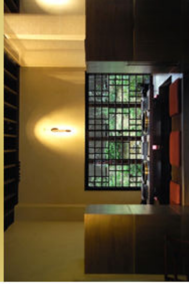
庭園を望む庭家廊 幅り庭焼式でおくつつるをいただきます。