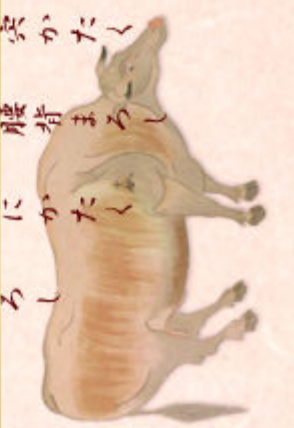
写真は録音機で録りに描かれた「四牛十四」上写真は、このために記された四馬牛の特徴です